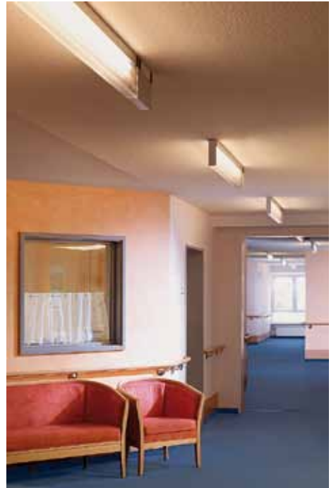
Abend: Beruhigende und gemütliche Abendstimmung