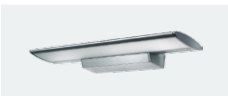
D-lite® amadea 2x39 W