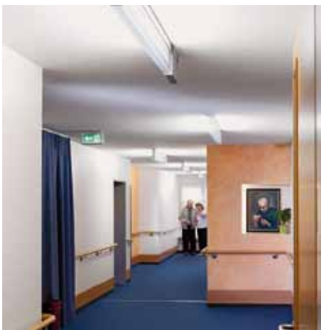
Hell: Tageszeit entsprechende Helligkeit