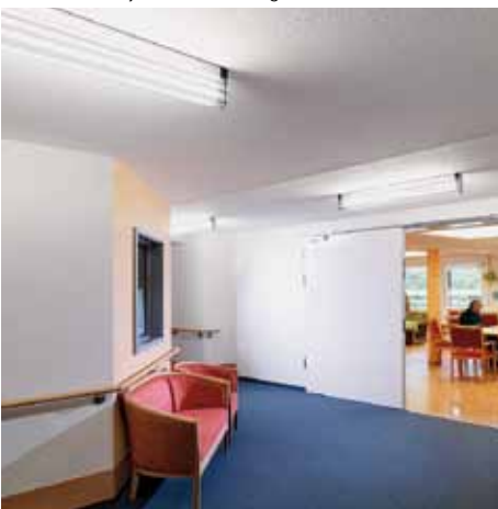
Gut gelöst: Durch eine spezielle Anordnung der Deckenleuchten wird jeder Winkel ausgeleuchtet