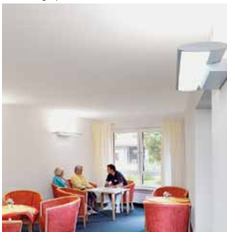
Vriendelijk: gemeenschappelijke ruimte als plaats voor een gesprek