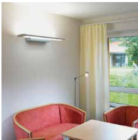
Huiselijk: een passende lichtsterkte